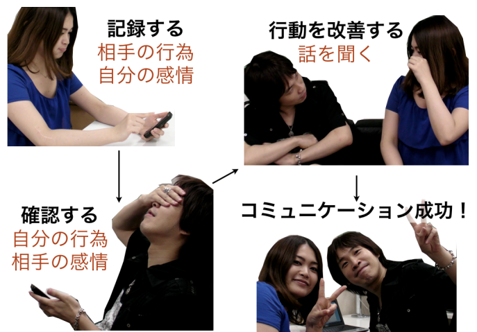
図 2. ふたログの概要: 相手の行動とそれに対する自分の気持ちをログに記録すると、相手はそのログを確認することができる。ログを見て反省し、行動を改善したり態度を改めたりすることで、カップルのコミュニケーションが円滑に進む。

1つ目は、お互いがお互いの行動をログにとることによってカップルのコミュニケーションを支援する「ふたログ」である。本アプリケーションの概要を図2に示す。