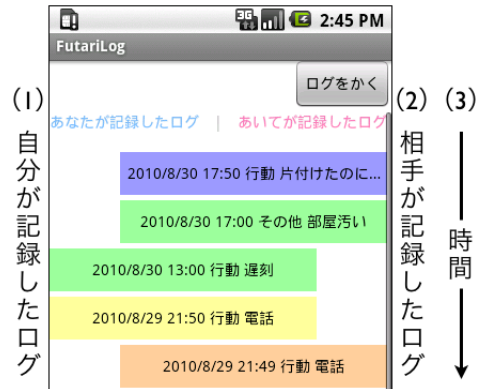
図 4. ログ確認画面：(1) 画面左側に自分が記録したログが、(2) 画面右側に相手が記録したログが表示される。(3) 2 人のログは新しい順に上から表示されている。

ると同時に相手が最近、自分に対してどのような感情を持っていたかを知ることができる。