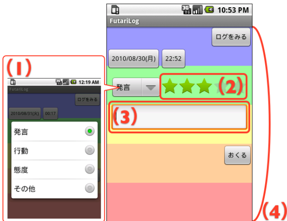
図 3. 相手の行動のログを記録する際に用いる画面： (1) ログに残したい相手の動きの種類を「表情」「行動」「態度」「その他」の中から選択する。(2) 自分の気持ちを星の数で表す。(3) コメントを残す。(4) 相手が記録した感情のログのうち、最新の 5 件を背景色で上から順に表示する。