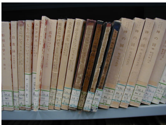
図 1 廃れた書籍

ここで問題となるのは、Web ページはどんなに古くなっても決して外見的に廃れることはないという点である。更新を全く行わなくてもページの見た目は変わらないため、どれほど情報の価値が低下していても一目でそれとはわからない。一方、現実世界に目を向けてみると、現実世界のモノは古くなると徐々に外見的に廃れていくのに気づく。例えば、古くなりあまり読まれなくなった書物は、傷ついたり変色したりして、すぐに情報の鮮度を見分けることができる (図 1)。