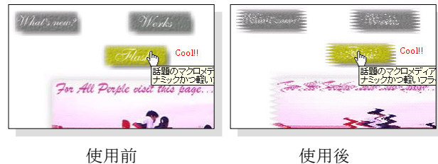
図 3. 我々の 1 人のページ

何を隠そう我々の 1 人のページこそそれである (図 3)。本システムを利用することで、怠惰なページ管理者に自分のページの悲惨な状況を視覚的に提示することができ、積極的な更新を促す効果が期待できる。