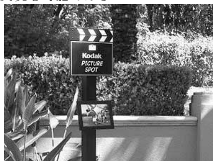
図 1：Disney Theme Park の Picture Shot

また、旅先から撮影した写真を自動アップロードする機能により、自動的に旅行記ブログなどを更新できる。写真を撮った時にコメントやスコアを付けることにより、ユーザの視点に立ったお薦め度を記録することもできる。これにより、より自分の好みに合わせた名所を提示する機能の実現も可能である。