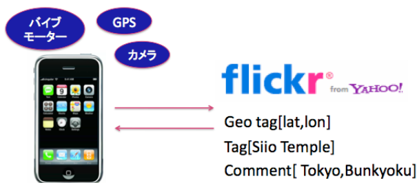
図3:本システムの構成図

ユーザが撮影を行うと、その写真が Flickr にアップロードされる。その際に、geotag に加えて、新たに tag, comment というタグを追加し、iPhone から入力した場所の名前やコメントなどを登録する