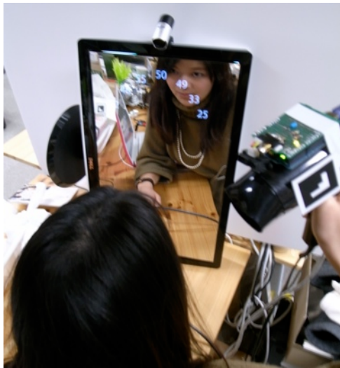
図3：プロトタイプの利用例：ディスプレイとハーフミラーを組み合わせ、髪の毛の周囲に温度情報を提示する。

二次元コードを検出する。現在の実装では、検出したドライヤー位置に、非接触温度センサで検出した温度を黒背景上に白色表示している。これにより、図3に示すように、ハーフミラー上のユーザの鏡像に重ね合わせた情報提示を行える。図4にシステム全体の構成図を示す。なお、図3は、ユーザ視点からの写真でないため、ユーザ頭部鏡像と温度表示がずれている。一般にハーフミラーを利用したARシステムを作成する場合には、ユーザ位置を測定して、視点に合わせたAR表示が必要である。本システムは、ヘアドライ時にはユーザが鏡の正面に居ることを前提としたため、ユーザ位置検出を省略した、実用性の高いシステムとした。また温度表示位置も、想定されるユーザ頭部位置周辺に限定することで、安定した見やすい表示が可能となった。