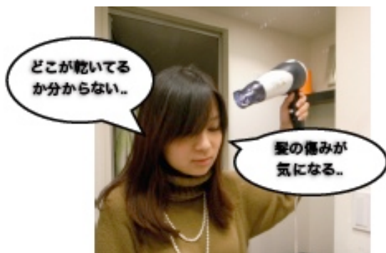
図1：ヘアドライ時の課題

そこで、我々は、ヘアドライ中の髪の温度を視覚化することで、ユーザの適切なドライヤーの利用を支援するシステムARDryerを提案する。