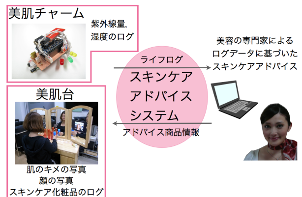
図1 システム概要図

しかし、肌には睡眠時間や食生活、ホルモンバランス、紫外線や乾燥などの自然条件、精神的なストレスなども関係していることが分かっており、これら様々な要素の管理を毎日続けることは、面倒で困難である。また、努力して管理したとしても、適切なスキンケア方法の知識をしっかりと持っている女性は少なく、満足できる美肌を保つことは難しい。先のアンケートにおいても、実際にスキンケアを施しているのはスキンケアに興味のある女性のうちの6割程度になっている。美肌対策を講じない理由として、「正しいスキンケア方法が分からない」などもあげられていた。また、株式