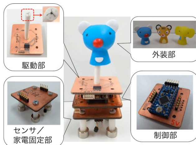
図 2. プロトタイプ：外装部、駆動部、制御部、センサ／家電固定部から成る。外装部は付け替え可能。