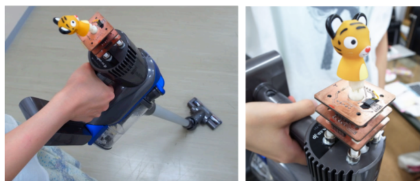
図 3. 掃除機に装着した様子

電子レンジにおいてはドアの開閉音, 動作音, 加熱終了音などを利用して, 電子レンジに取り付けられたことの検出と, 電子レンジの稼働状態を認識する。そして, ユーザが電子レンジを利用している間は, ロボットを左右に動かし, 加熱が終わるのを待